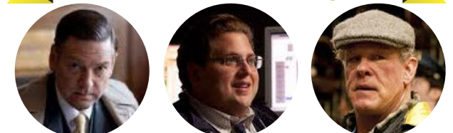
Kenneth Branagh My Week with Marilyn Jonah Hill L'arte di vincere Nick Nolte Warrior