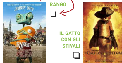
IL GATTO CON GLI STIVALI