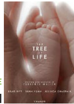
THE TREE OF LIFE