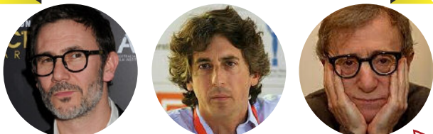
Michel Hazanavicius The Artist Alexander Payne Paradiso amaro Woody Allen Midnight in Paris