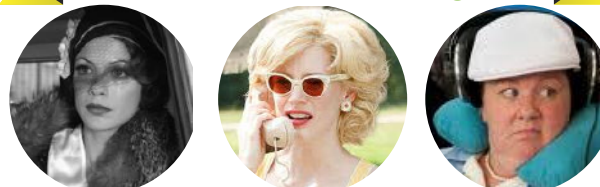
Bérénice Bejo The Artist Jessica Chastain The Help Melissa McCarthy Le amiche della sposa