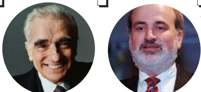
Martin Scorsese Hugo Cabret (Hugo) Terrence Malick The Tree of Life