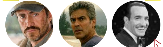
Demián Bichir A Better Life George Clooney Paradiso amaro Jean Dujardin The Artist