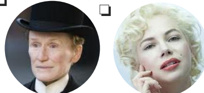
Glenn Close Albert Nobbs Michelle Williams My Week with Marilyn