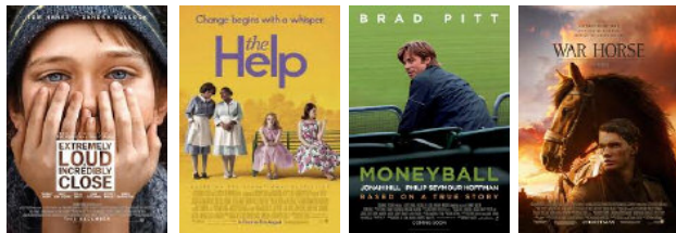
EXTREMELY LOUD INCREDIBLY CLOSE THE HELP MONEYBALL WAR HORSE